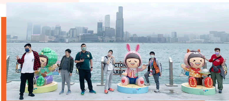
義工們陪伴會員外出遊玩，讓照顧者有喘息的空間。

本會承蒙利希慎基金資助的「關愛友伴—智障人士家居暫託計劃」，旨在招募社區人士擔任關愛友伴，為智障人士提供上門暫託及外出陪伴服務，以減輕智障人士照顧者的壓力。此計劃累計有174位義工曾提供服務，超過2,300人次受惠。