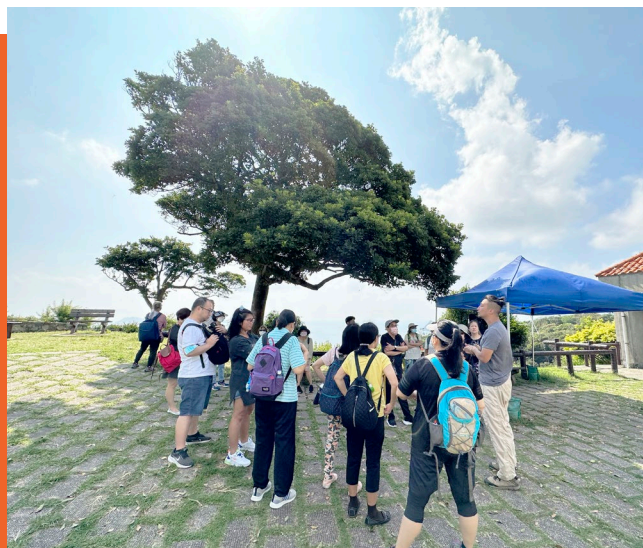
為照顧者舉辦「森林浴之旅」。

內「森」世界一地區為本支援照顧者計劃獲社會福利署觀塘區福利辦事處資助，為照顧者提供Me Time減壓小組及活動，如瑜伽、伸展班及行山活動等，讓超過100位照顧者藉此紓緩日常壓力，在應付繁重的照顧生活時，先好好關顧個人身心靈健康。