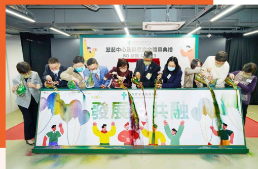
主禮嘉賓以色彩繽紛的閃粉裝飾本會殘疾人士服務的核心價值「發展及共融」五個大字。