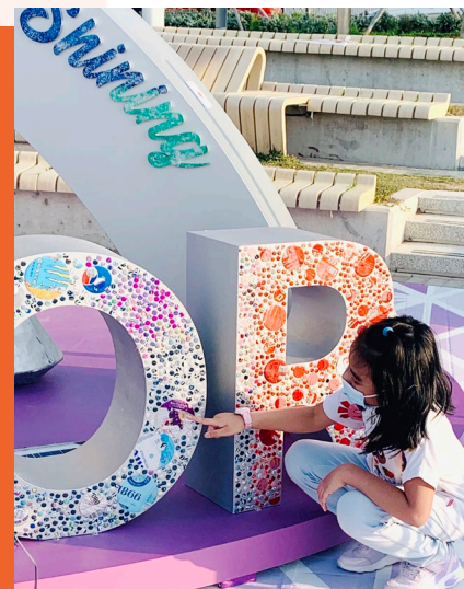
每顆閃亮的寶石都是由本會學員以環保鋁罐親手打磨而成。

本地設計品牌 Alchemist Creations Co. Ltd. 多年來與翠林綜合職業復康服務合作無間，學員一直參與回收環保鋁罐產品的再造過程。2022年中，品牌再度與翠林綜合職業復康服務協作，以「We Can Shine」為主題製作巨型藝術裝置。放置於灣仔海濱長廊的裝置由過萬顆汽水罐製成的閃亮寶石組成，本單位學員協助回收環保鋁罐產品及妥善處理後，將之打磨得閃閃發亮，猶如寶石一樣，象徵學員經訓練後也可以發光發亮。