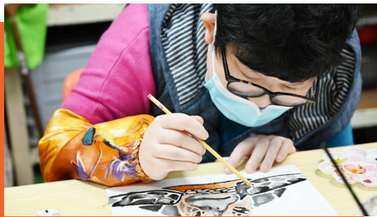
學員學習不同的藝術創作，透過繪畫，表達心中所想。

為持續推動殘疾人士對藝術創新的發展，培養他們的創作美感與技術建立，翠林綜合職業復康服務與輔助就業服務將繼續推動學員參與各項特色藝術培訓，為殘疾人士開拓更多發展機遇，並嘗試將學員的作品製成不同產品，提升實用及觀賞價值。