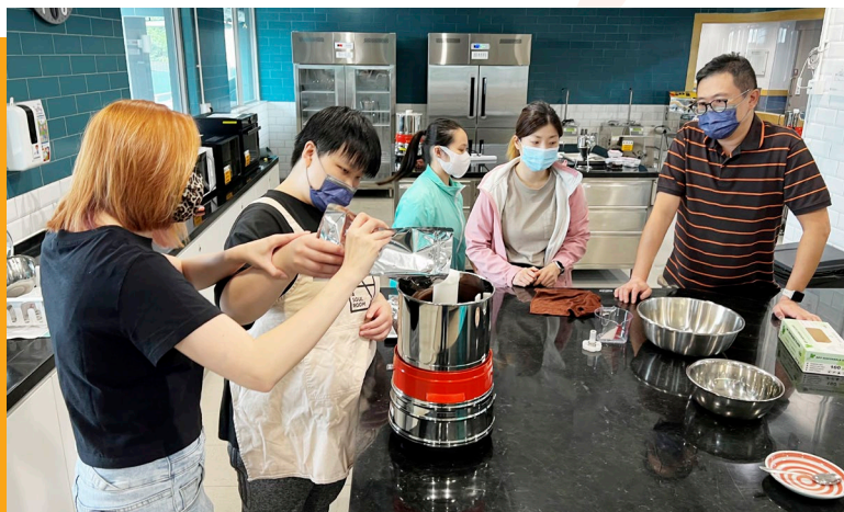
朱古力師教授中心同事和學員製作朱古力的技巧。