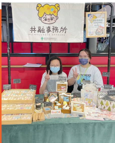
受訓學員在共融市集擔任「一日檔主」。

共融事務所於2022年10月正式成立，屬殘疾人士發展及共融發展項目之一，以推廣共融為目標。殘疾人士學員會親手製作產品及包裝，並擔當「一日檔主」負責推廣銷售，向公眾展現及發揮自身能力與天賦。