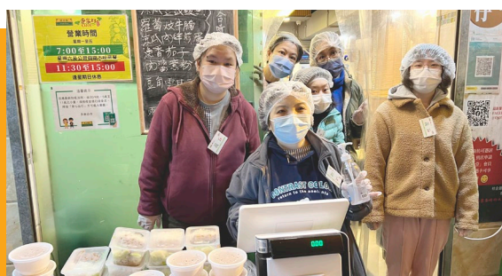
學員到深水埗區參與地區團體的派「福飯」活動。

翠藝中心致力在深水埗區連繫不同團體及擴展僱主網絡，為學員尋找工作機會，同時讓學員與社區人士增加認識和建立關係，從而推廣共融信息。去年，我們在深水埗區成功連繫22個團體及僱主，我們深信學員具有發展潛能，不限於受助者角色，也能貢獻社會，藉着參與不同形式的社會及義工活動，令生活更多元豐盛。