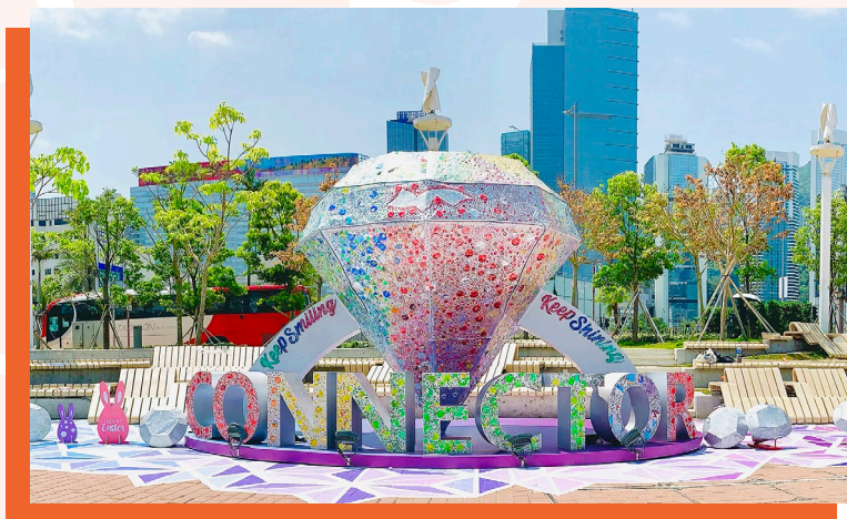
名為「We Can Shine」的藝術裝置，飾以過萬顆由學員製作的「汽水罐寶石」，寓意每個人都可以從平凡中蛻變成無價寶。