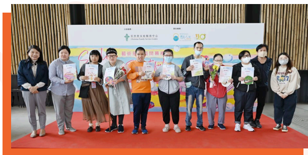
參加者獲贈的紀念杯墊印上由自己創作的繪畫作品，別具意義。