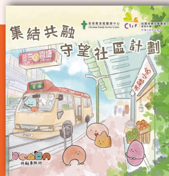
「集結共融守望社區計劃」透過多元化社區活動推廣共融理念。

承蒙社區投資共享基金撥款約300萬元資助，共融事務所於2023年4月在觀塘區推行為期三年的「集結共融守望社區計劃」。運用「社、福、商」跨界別協作模式，透過街站、講座等外展手法，推廣共融理念，提升社區人士對智障人士及其照顧者的關注；培訓社區人士成為「守望員」，發揮守望相助的精神，支援智障人士及其照顧者的需要，建立鄰里支援網絡；同時組織照顧者互助小組，連結不同界別組成協作網絡，以推動及建立共融社區，預計連繫參加者、義工及社區人士多達25,000人次。