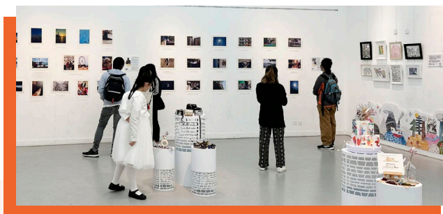
藝術展覽共展出超過150件殘疾人士畫作及攝影作品。