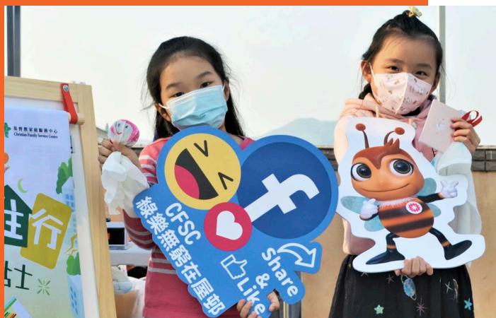
透過「綠樂無窮在屋邨」嘉年華，宣揚衣食住行低碳資訊。