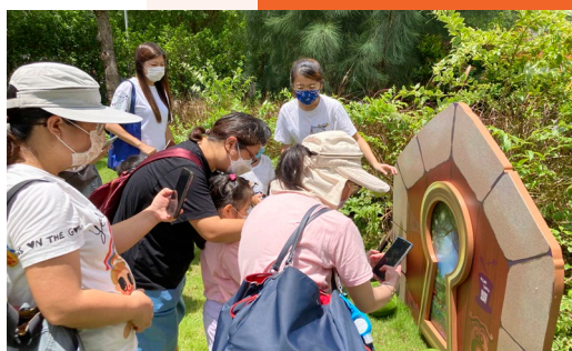
掃描木門上的二維碼，對準鎖匙孔，參觀者便可透過AR擴增實境技術化身成愛麗絲，在屏幕上與大唯鬼一同走進「夢遊仙境」國度。