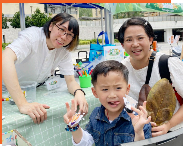
家庭成員一同學習運用廢紙製作玩具。