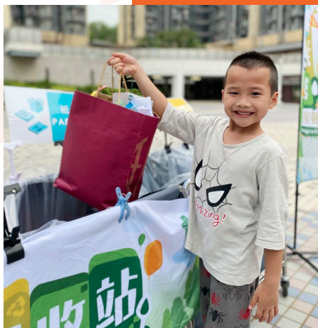
嘉年華活動鼓勵從小培養回收習慣，建立環保意識。