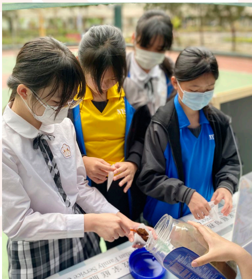
公眾於工作坊學習利用咖啡渣進行升級再造。