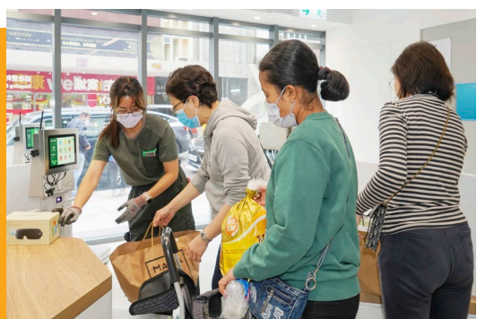
前線職員向市民講解回收方法及流程，宣揚乾淨回收信息。

本會於2023年1月再次成功投得環境保護署「回收便利點」的後續營運合約，分別為「綠在裕民坊」和「綠在寨城」，並新增營運「綠在紅磡」和「綠在土瓜灣」兩項服務，使回收服務擴展至整個九龍城區。「回收便利點」主要回收各類型塑膠，同時可接收多種其他回收物，並提供夜間自助回收服務。