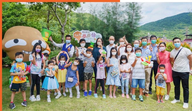
「大唯鬼夢遊仙境」吸引區內家庭前來「綠在西貢」參與活動，場面熱鬧。