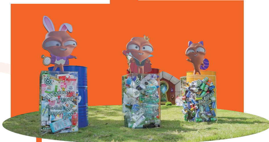
大唯鬼化身成白兔先生、紅心皇后及柴郡貓，向大家推介「綠在西貢」最新環保活動及回收資訊。