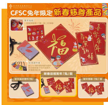
一套三款揮春「兔」裝附有賀年貼紙，讓小朋友發揮創意 D.I.Y.。