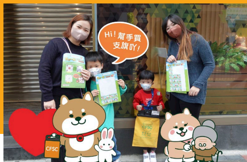
所籌得善款用作發展及提升本會多項社會服務，共建關懷社會。