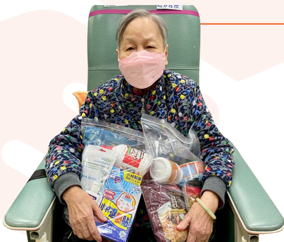
長者們感謝善長的捐助，令他們渡過難關。