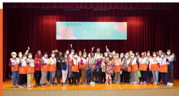
一眾義工無私付出，全情投入支援弱勢社群。