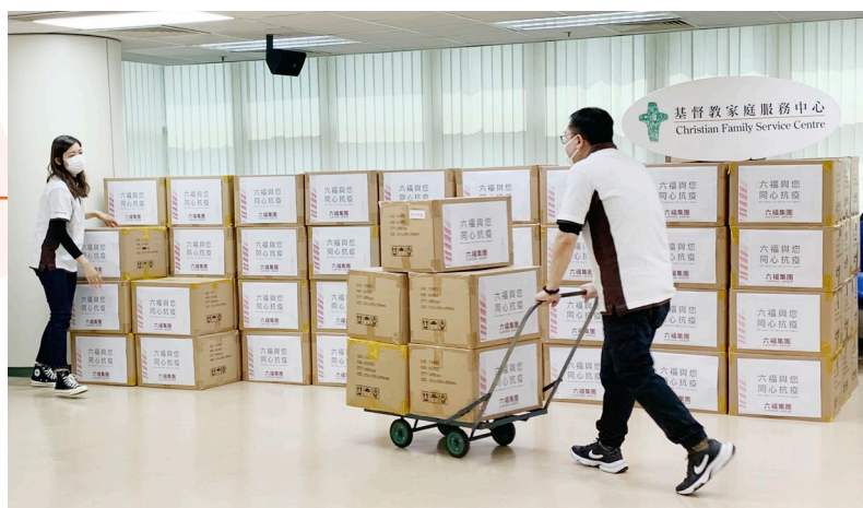
食品及日用物資在疫情下需求大增，本會幸獲多間企業伸出援手。

本會當時獲超過20間善心企業或基金迅速回應，獲贈近20萬件產品，包括口罩、搓手液、消毒清潔劑、消毒濕紙巾、米、罐頭、麵食、沐浴露、餐飲券及超市現金券等，總值約540萬元，大大減輕弱勢社群的經濟負擔。