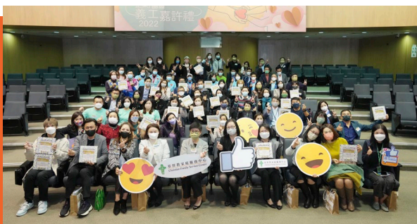
得獎義工們聚首一堂，大家互相分享和鼓勵。

由於獲嘉許人數眾多，「企業／團體義工嘉許禮」及「個人義工嘉許禮」分別於兩日舉行，合共有近200名個人義工，以及76個機構與團體獲獎。義工參與服務的總時數多達20,381小時，受惠者共149,115人次。