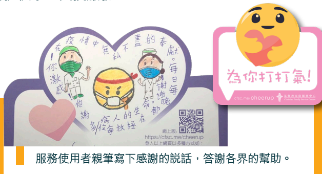
服務使用者親筆寫下感謝的說話，答謝各界的幫助。