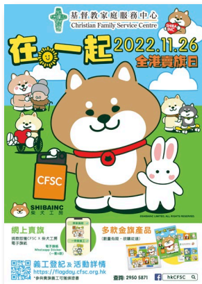
賣旗日以「在。一起」為主題，並首次與「SHIBAINC 柴犬工房」合作。

是次活動得以順利舉行，有賴各方協作，包括企業伙伴、媒體贊助、團體及學校，還有站在前線的6,000名賣旗義工和在不同崗位提供支援的同事們，以及用行動買旗支持的每一位市民。賣旗活動共籌得超過186萬元，善款用於為有特殊教育需要的兒童提供教育及培訓、改善貧窮家庭及劏房戶的生活環境、支援基層服務使用者購置資訊科技或輔助器材，並為照顧者提供緊急支援服務。