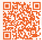
「新年進步證件『兔』」製作花絮

為協助殘疾學員發揮潛能，本會提供多元化技能訓練，讓他們有機會憑着天賦和努力盡展所長。於農曆新年，我們特別推出別出心裁的兔年新春慈善限定禮品，包括由本會學員親手縫製的皮革證件套，以及由 CFSC 幼稚園學生繪製的賀年揮春 D.I.Y. 套裝，加深公眾對殘疾人士的才能，以及對本會服務的認識。義賣活動除了鼓勵殘疾學員發揮所長，建立自信外，亦為本會服務發展籌募經費，提升支援兒童、殘疾人士和基層家庭的服務質素。