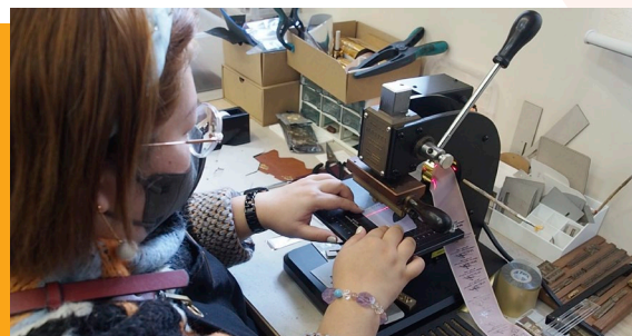
由學員一針一線縫製的「新年進步證件『兔』」既實用又別具意義。