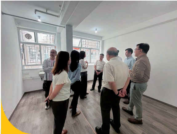
董事會成員與前線員工及服務使用者交流，了解過渡性房屋的環境和住戶需要。

管理層去年亦到訪不同服務單位，實地了解各部門同事的工作情況，了解前線工作所面對的挑戰，以便日後參考及跟進，制定策略性規劃。