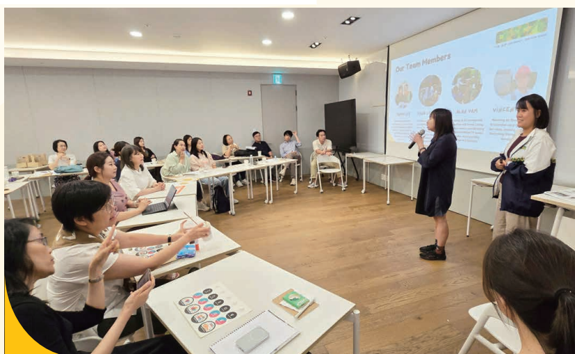
👉 透過人事管理及培育人才能力，促進跨單位合作，激發更多嶄新的服務創意。