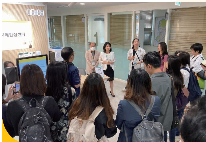
👉 透過與不同地區的機構交流分享，以擴闊同工的創意思維，提升服務水平。

踏入70周年誌慶，CFSC秉承不斷創新，追求服務成效的理念，設立四個策略方向推動變革，包括由去年起展開為期三年（2023-2025）的全新策略計劃，推行人事管理、人才能力、質素管理、應用科技與數碼化。為更緊貼回應服務使用者的需要，在照顧者服務、扶貧服務、精神健康服務及醫社合作服務，我們訂下四個優先發展項目，聯同社會各界一起迎接未來的機遇及挑戰。