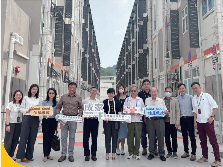
本會策劃「成家」社會房屋計劃，董事會成員前往落成後的單位參觀。

為加強董事局與各部門之間的溝通，董事會成員定期到訪服務單位。今年董事會到訪「成家」社會房屋項目及和悅軒—精神健康綜合社區中心參觀，期間與前線員工及服務使用者交流和分享，了解服務發展和需要。董事會成員欣賞同事的努力及創意，未來將繼續到訪不同服務單位，了解服務發展及加強溝通。