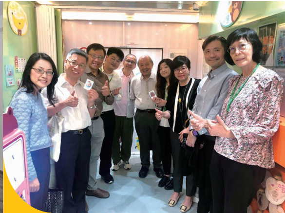
參觀幸福雜貨舖—精神健康流動宣傳車，了解團隊於社區推廣精神健康的工作。