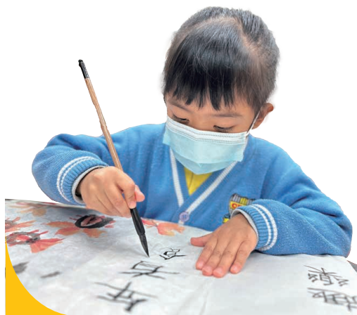
學生親手寫揮春佈置學校，從中學習中國傳統文化。