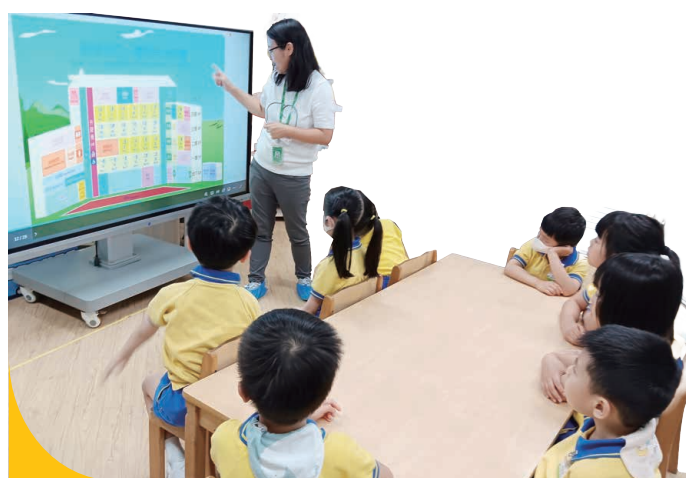
導師為高班學童介紹小學校園。

透過一系列升小適應活動，包括家長講座、小組及親子活動，協助家長和學童輕鬆適應升小過渡期。計劃首年共有300位家長及學童參與，家長透過參與講座及小組了解子女的情緒、社交、學習模式等各方面的挑戰，以及運用正向管教的技巧協助子女面對小一新生活。參與家長均滿意計劃內容，認同服務能減輕家庭升小的壓力，同時更能掌握管教技巧。