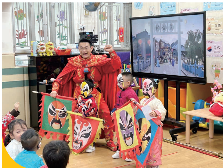
變臉可在瞬間變換多種不同臉譜，令人目不暇給。

為了讓兒童從小認識和欣賞中華文化，本會屬下三所幼稚園於本年度舉辦一連串中華文化體驗活動，讓幼兒認識中國不同面貌，學習欣賞傳統文化的善與美。學校設計多項與中華文化相關的學習活動，幫助兒童持續探索，更於農曆新年前舉辦中華文化活動週，引導兒童聯繫生活經驗，認識傳統節日、食物、藝術、建築及運動，親身感受傳統文化，逐步建立中國人的身份認同，並配合新聞時事、生活分享，幫助兒童認識國家發展和成就，初步培育兒童對國家的歸屬感和自豪感。