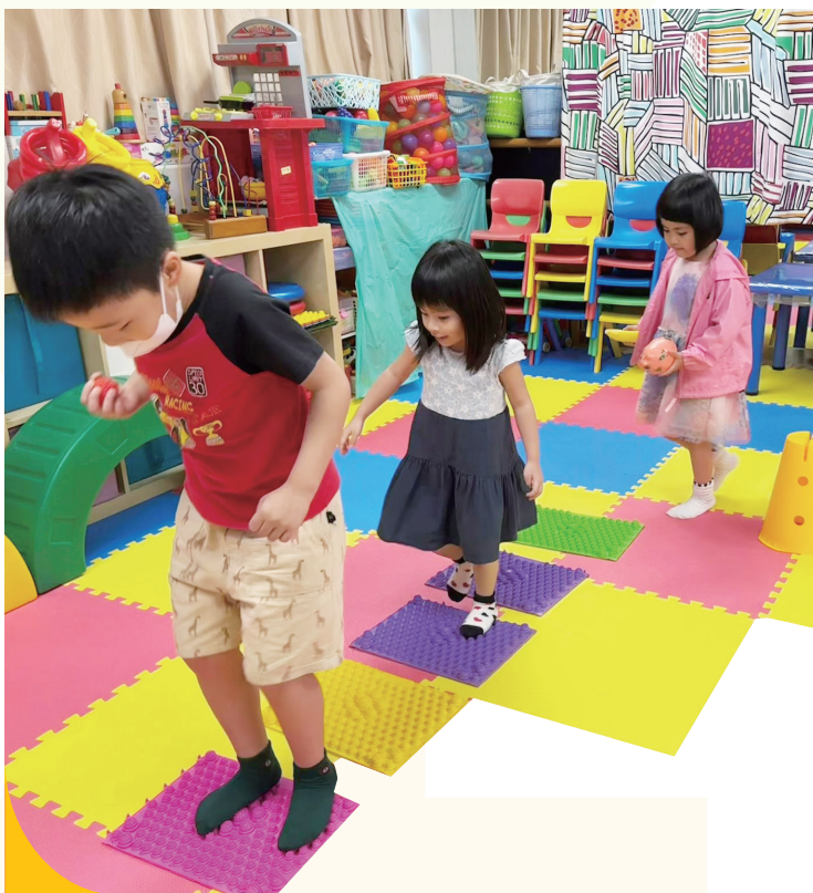
大家排排隊玩遊戲。

隨着有特殊教育需要(SEN)，尤其情緒管理與專注力不足的學生人數日漸增加，成龍全人發展中心於2023-2024年度特別開設由專業社工及特殊幼兒教師帶領之課程活動，如「EQ•專注力訓練學堂」、「EQ•自理學堂」等，過去一年參與人次達510人，為有需要之幼兒提供課後支援與訓練，減輕家長壓力。參與活動的家長表示，見證課程協助幼兒在情緒及行為上有所改善，感覺滿意。