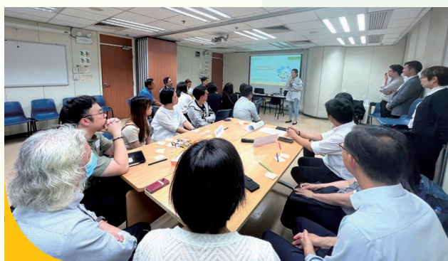
參加會議的老師們，聚精會神了解青少年精神健康的服務方向。