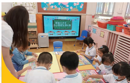
高班學童透過小組活動認識幼稚園與小學在學習模式上的分別。