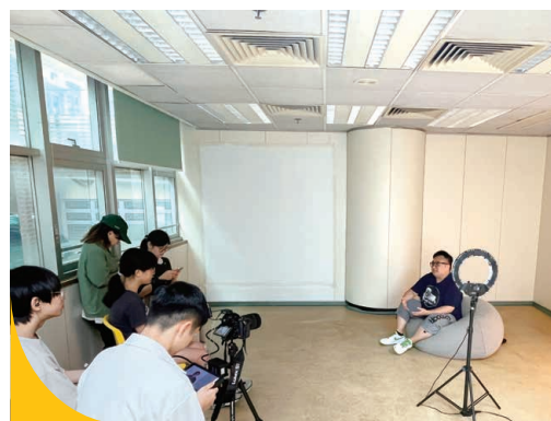
青少年專注地為微電影進行訪問拍攝。