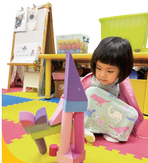
玩具可以訓練小朋友的大小肌肉發展，更有效提升想像力。