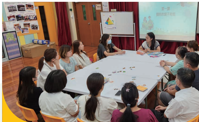
家長們學習如何與小朋友相處，享受親子時間。