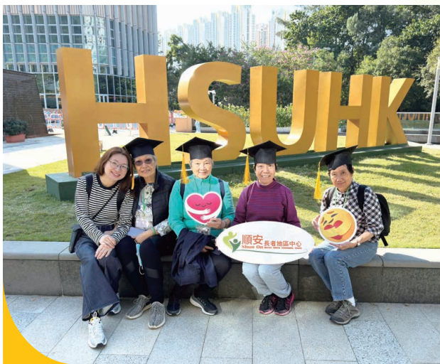
舉辦計劃嘉許禮，以表揚長者們積極參與藝術及社區交流活動。

「回家」是一個概念，我們希望中心成為一個「家」，為會員、照顧者提供強大後盾和支援，當他們有需要時，會想起中心，就像家人一樣；我們亦會時刻留意長者的需要及變化，提供到位服務，幫助長者和照顧者重回社區這個「家」，一起同行。