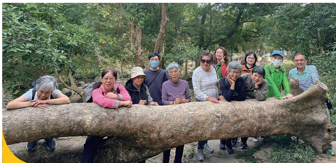
老有所為活動計劃「小確幸・好生活」舉辦森林浴活動，以增進健康和快樂為目的。

今年中心銳意發展男士的關顧工作，以開辦「真男人」小組為工作主線，為男性長者會員提供聚腳地，每星期設有相聚時間，透過多元化活動，包括擲飛鏢和桌遊等，讓他們有機會接觸新事物，強化及維繫男性會員間的支援網絡，一年以來，男性天地的參加人數不斷增加，共510人次參與各項活動。