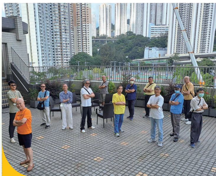
「真男人」小組讓男性長者會員有一聚腳地，透過多元化活動，讓他們有機會接觸新事物，強化支援網絡及增強對中心的歸屬感。