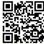
了解更多 尋找快樂終老秘笈漫畫繪本