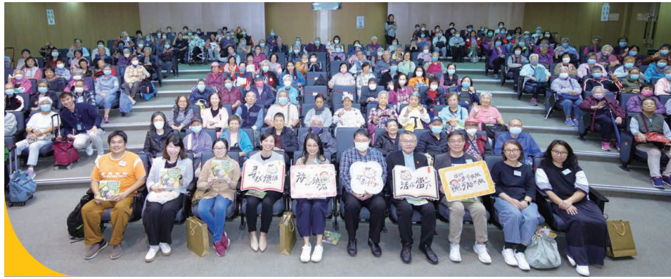
舉辦主題總結活動：「放下石頭，笑看生死」展覽暨講座。

中心亦鼓勵長者及照顧者學習珍惜現在，建立盼望，規劃未來。我們推展「放下石頭」生命教育活動系列，舉行「生死『無』限期?!」互動體驗站、「放下石頭月」讓參加者分享及交流對未來的憂慮，及製作「尋找快樂終老秘笈漫畫繪本」探討快樂終老的奧妙。