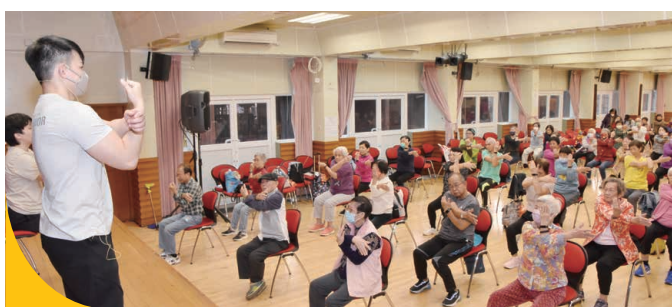
60位參加者於「賽馬會痛正能量」嘉年華中體驗運動紓痛的良方。

不少長者留在家中減少出門，其中一個主要原因是「痛症」。今年「賽馬會痛正能量計劃」舉行不同活動讓長者及大眾認識痛症自我管理的重要性、引致痛症的原因、關節保養及各種紓痛運動等。計劃亦與區內長者鄰舍中心合作，令痛症患者得到身心靈的支援，重投社區生活，改善因痛症帶來的負面生活質素，計劃共有6,834人次參加。