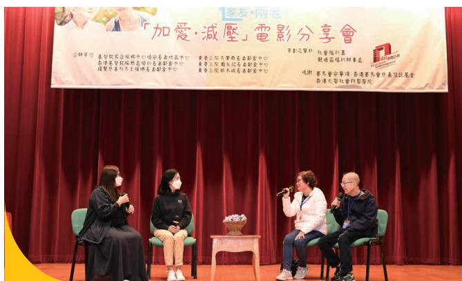
「加愛・減壓」電影分享會，電影導演黃懿德女士及三位同路人分享正面信息。

不論長者還是照顧者，均承受不同程度的壓力，長者的壓力主要來自疾病和身體衰退，照顧者的壓力則來自照顧長者及生活上的不同挑戰。為鼓勵及協助體弱多病的長者及照顧者接觸社區，中心今年二月特別租用巴士帶他們出外走走，遊覽青馬大橋，及到尖沙咀觀賞花燈晚會，希望透過活動讓他們明白中心可作他們的後盾，人生道路不是孤單，而是共同分擔。