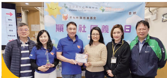
與「老有所醫慈善基金」合辦「順安社區義診日」，為區內超過200位有需要的長者提供超過400人次的義診服務。

今年我們選擇「回家」作為主題，讓長者和照顧者再次進入社區。經過一年，長者及照顧者正以不同步伐重回社區，中心在未來將繼續把握機會，提供一個連結的平台，強化長者及照顧者與自己及周邊的接觸，協助服務對象建立連繫，讓長者及照顧者，與自己、家庭、鄰舍、社區和社會建立良好的互動網絡。