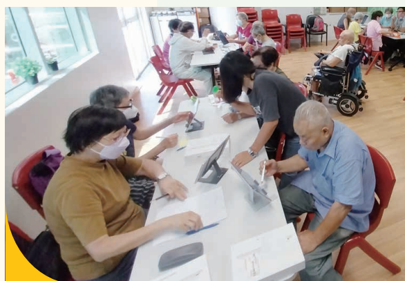
500部平板電腦派發予計劃的參加者，同場指導他們基本使用技巧。

長者地區中心一直重視線上工作，加速推動「樂齡科技」，希望令長者不受環境及時間限制，與外界保持連繫。長者享受科技帶來的樂趣，但同時拉闊了數碼鴻溝，部分不懂使用科技的長者，墮後的步伐更明顯，因此中心開展「賽馬會平板電腦支援計劃」，推動「樂齡科技」學習，共7,426人次參與。