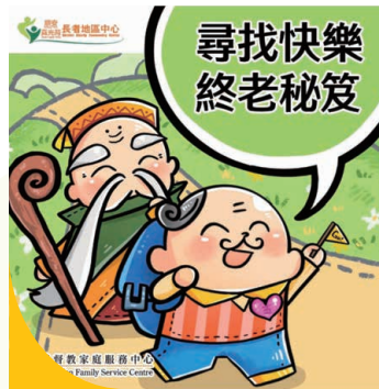
建立樂觀的盼望是尋找快樂終老秘笈的重點。