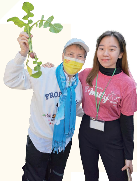
長者與恒大的學生義工打成一片，互相交流與學習，促進長幼共融。

中心今年與香港恒生大學合辦「大學生體驗之旅」，讓長者做一日大學生，在大學上課及到餐廳與學生用膳，讓他們感受校園氣息，體驗多元學習，與學生打成一片。學生義工更擔任「組爸、組媽」，分組帶領長者體驗大學生活，互相交流與學習，促進長幼共融。