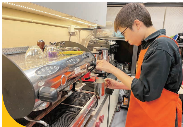
學員們細心學習咖啡的沖調技巧。

我們舉辦的「看建」系列課程、烘焙師課程及咖啡師課程，合共有37人參與。咖啡師訓練課程成功培訓六位學員獲得「COFFEE Lover International Barista School」國際咖啡師資格。由我們學員組成的看建咖啡師團隊，已進行11次社區咖啡服務，服務人次為323人。