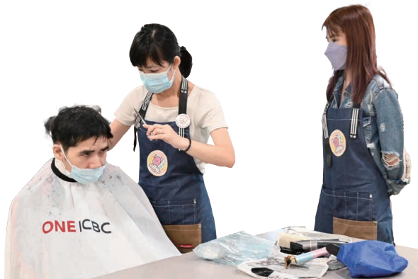
「守望員」身體力行支援智障人士及其照顧者。

獲社區投資共享基金撥款約300萬港元資助，共融事務所在觀塘區推行為期三年的「集結共融守望社區計劃」，提升社區人士對智障人士及其照顧者的關注；計劃成功培訓86名社區人士成為「守望員」，及組織照顧者互助小組，連結不同界別組成協作網絡，期間進行超過180節活動，同時舉辦「共融祭」、「集結共融填色比賽展覽」等活動，參與人次約2,000人。