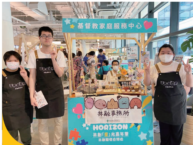
「共融事務所」過去一年參與30場市集，邀請50位學員擔任「一日檔主」，推銷由本會殘疾學員親手製作或包裝的產品，全年接觸社區人士超過10,000人。