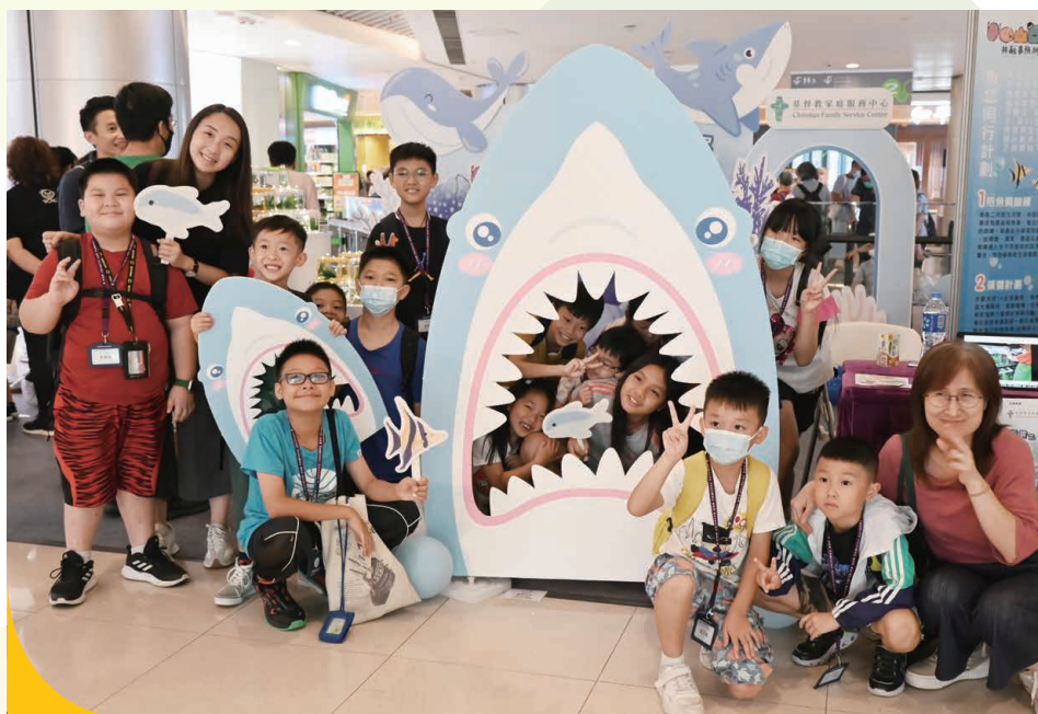
「魚您同行」計劃，在油塘大本型商場及裕民坊商場進行成果展覽，讓參加者反思生命意義，推廣社區共融。