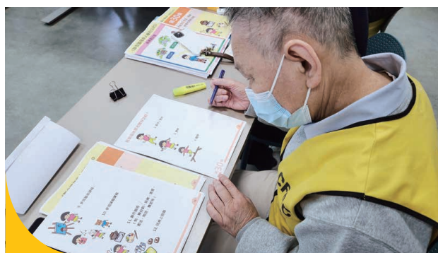
學員了解資料後，將抽象的意念透過畫作表達出來。

翠業坊與外間機構合作推出圖文簡易書籍，讓學員主導作品創作，根據學員的理解繪畫出聯合國《殘疾人權利公約》內容，通過此方式，讓智力障礙人士也能理解較為抽象深奧的概念。