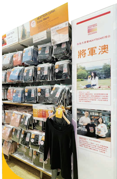
Uniqlo (HK)將軍澳分店邀請翠林工場參與宣傳活動。

翠林工場獲Uniqlo (HK)邀請參與其將軍澳三間分店的銷售品宣傳，當中展示的產品利用學員畫作印製在Uniqlo衣服上，盡展學員的藝術潛能。