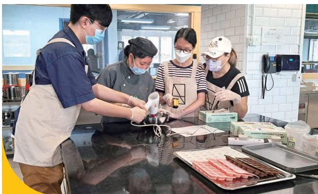
不同企業參加由翠風中心舉辦的朱古力工作坊，藉此促進殘疾人士與社會大眾交流及互動。

翠風中心20位學員經歷一年持續訓練，由原豆開始至投入朱古力製作，當中每個生產過程，都交由學員努力完成，生產出屬於他們的手工朱古力。現時中心透過向公眾人士、企業及團體提供產品訂購，促進殘疾人士與社會大眾的交流互動，讓學員的能力得到讚揚及認同。