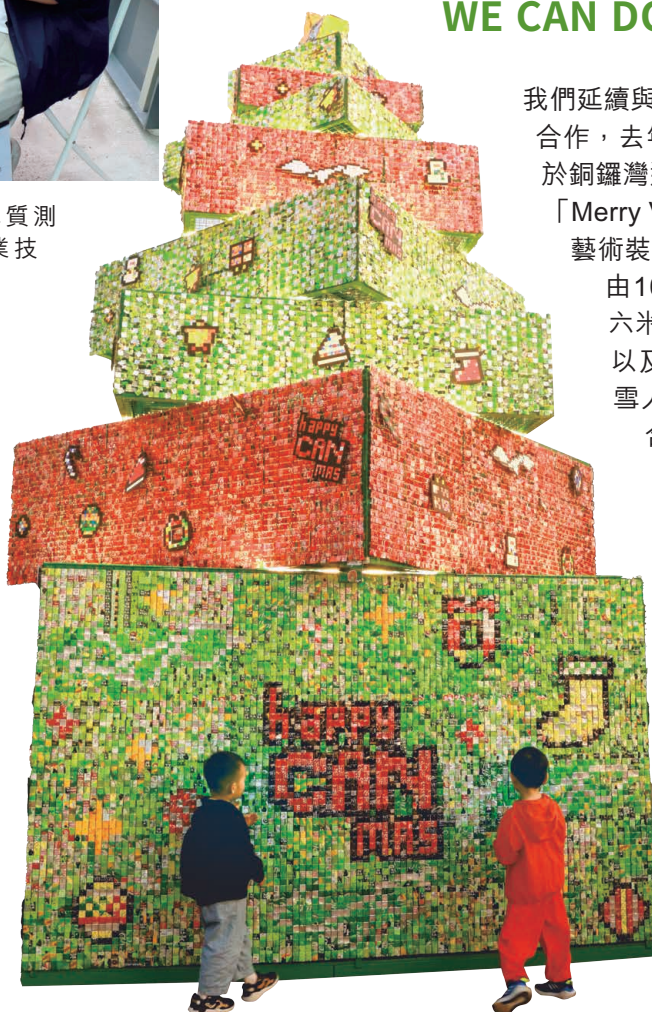
巨型聖誕樹上的鋁片由翠林工場的學員一片片加工打磨而成。

我們延續與Alchemist Creations Co. Ltd.的合作，去年聖誕節伙拍海濱事務委員會，於銅鑼灣避風塘用回收鋁罐製作一個名為「Merry Village • Happy Can Year」的藝術裝置。「Merry Village」內有一棵由10,000個回收汽水罐升級再造的六米高「CAN Mas Tree聖誕樹」，以及一個由「罐寶石」聖誕老人、雪人和薑餅人組成的「CAN Bless合唱團」。這些作品都由翠林工場的學員由回收環保鋁罐開始，再一片片加工，按設計圖紙組裝而成，由他們親身印證「CAN do」態度。