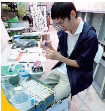
學員正進行系統水質測試，學習現代農業技術。